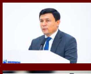
Respublika ilmiy-nazariy va amaliy seminaridan fotolavhalar