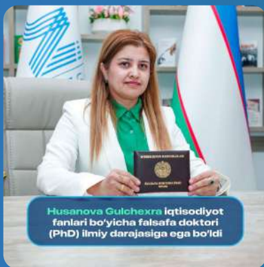
Husanova Gulchexra Iqtisodiyot fanlari bo'yicha falsafa doktori (PhD) ilmiy darajasiga ega bo'ldi