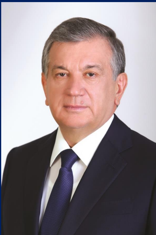
SHAVKAT MIROMONOVICH MIRZIYOEV